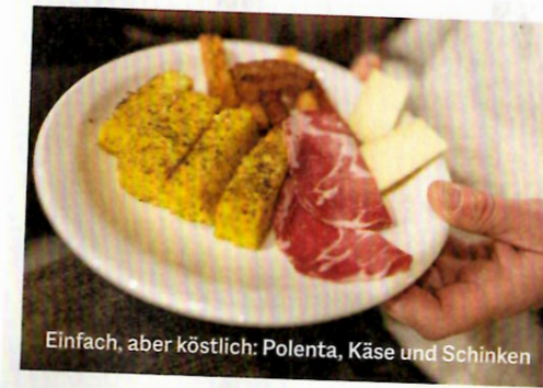
Einfach, aber köstlich: Polenta, Käse und Schinken

Nicht versäumen: Wer Zeit findet, sollte dem Haarmuseum in Elva einen Besuch abstatten: www.elvavallemaira.it/il-museo . Wer hinein möchte, muss den Lebensmittelladen »La Butego« kontaktieren: Tel. 00 39/33 98 20 47 64