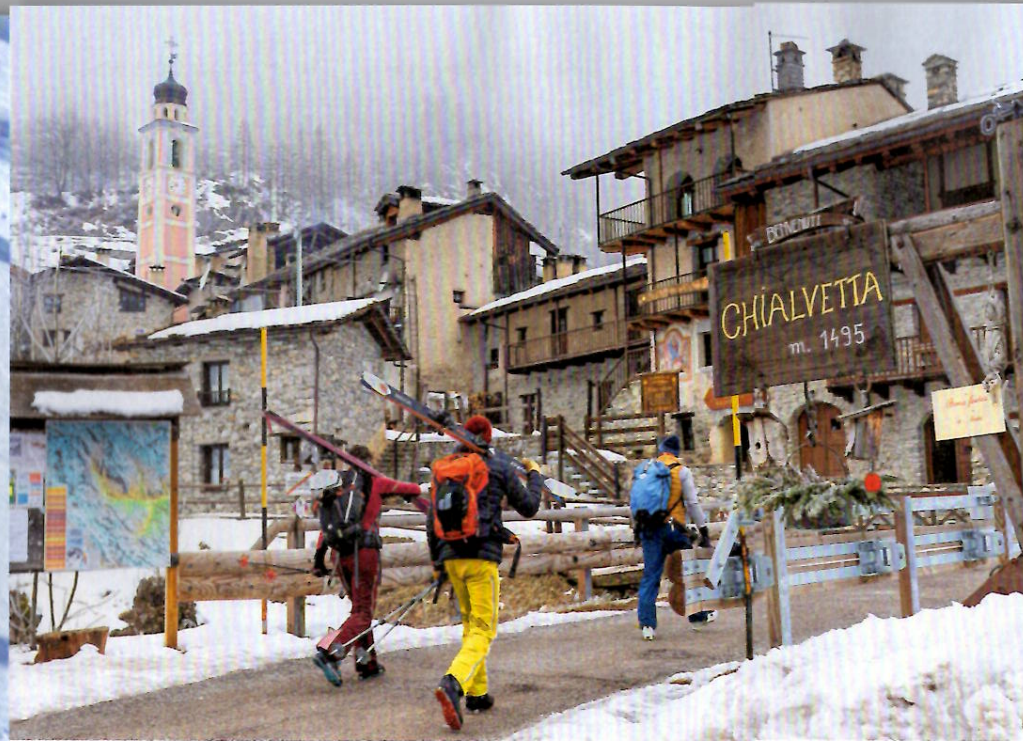
Origineller Auftakt: Wer bei Chialvetta zu einer Tour starten möchte, muss erst durchs Dorf marschieren (links). Während der markante Rocca Provenzale (rechts, in der Bildmitte) ein Ziel für den Sommer ist, gibt es rundum viele Optionen für Skitouren – selbst bei wenig Schnee.