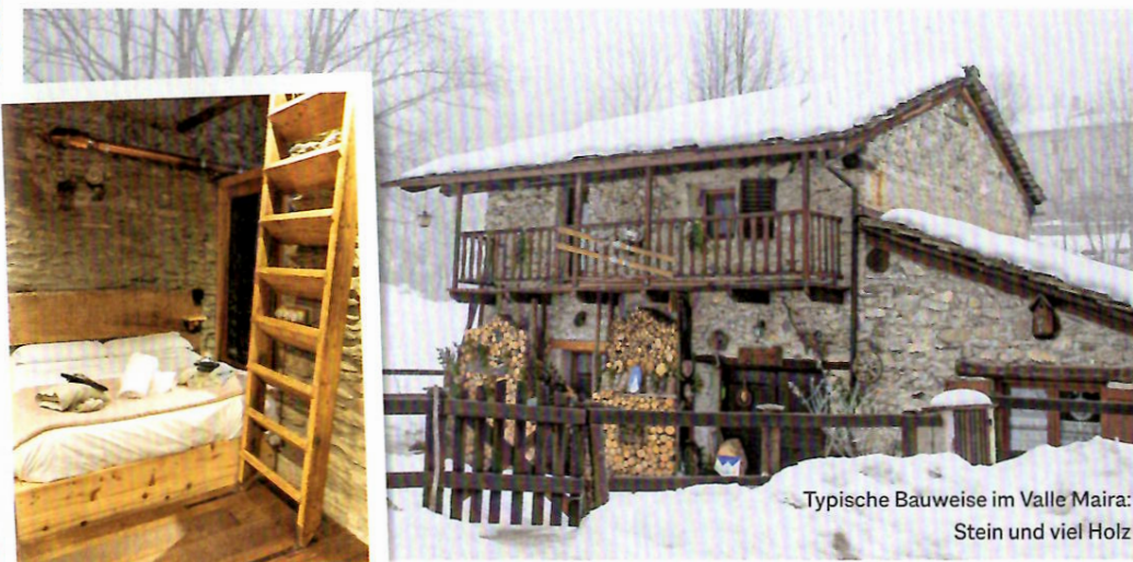
Typische Bauweise im Valle Maira: Stein und viel Holz