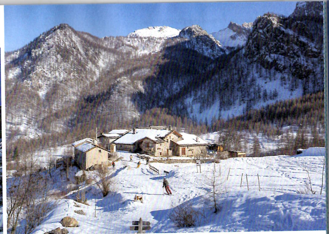
Willkommene Einkehr- und Übernachtungsmöglichkeit oberhalb von Chialvetta: das Rifugio di Viviere und das Rifugio Pratorotondo (oben). Links: Aufstieg zum Colle del Sautron

oder Venedig - es existieren unterschiedliche Versionen - mitbekommen, dass sich mit Menschenhaaren für Perücken Geld verdienen lasse. Im nahe gelegenen Saluzzo entstand schließlich ein richtiger Haarmarkt. Die Werkstätten, in denen die Haare gewaschen, nach Länge und Farben getrennt und an den Wurzeln zusammengesetzt wurden, befanden sich im Dorf Elva im Valle Maira. Doch auch diese Ära konnte die Abwanderung nicht aufhalten.