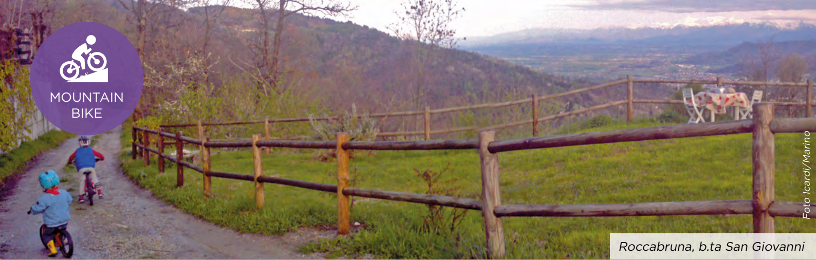
Roccabruna, b.ta San Giovanni